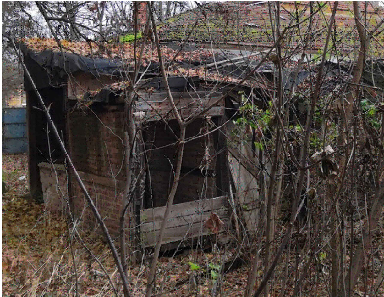
POHLED ČELNÍ - VÝCHODNÍ