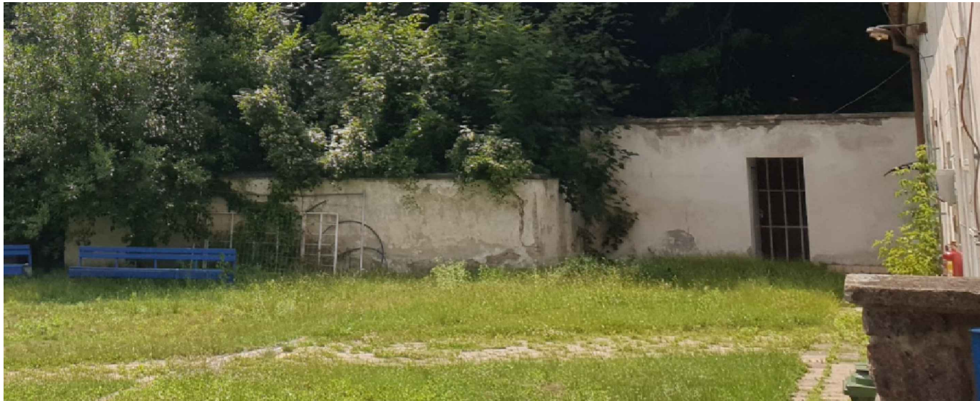
POHLED NA ZADNÍ ČÁST OBJEKTU - JIŽNÍ